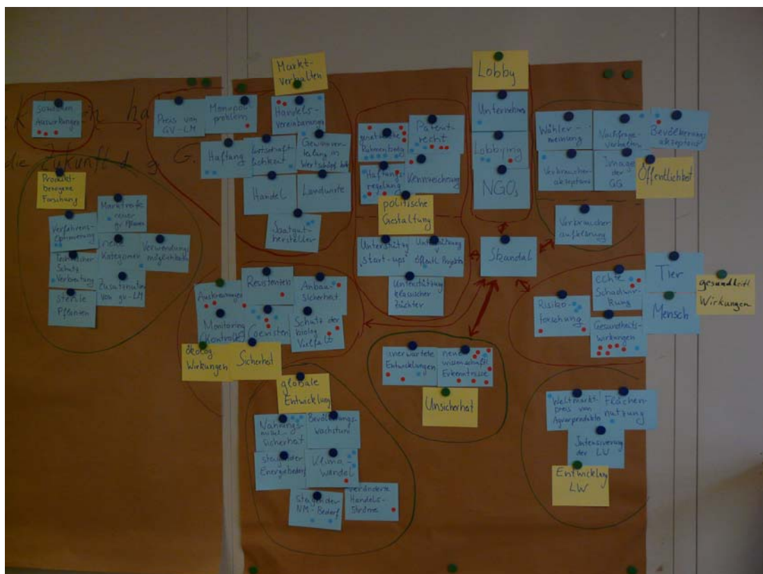
ABB. 7 BEISPIEL PUNKTKEVERGABE FÜR BEDEUTUNG UND UNSICHERHEIT ZUR BESTIMMUNG VON SCHLÜSSELFAKTOREN, WORKSHOP HOHENHEIM