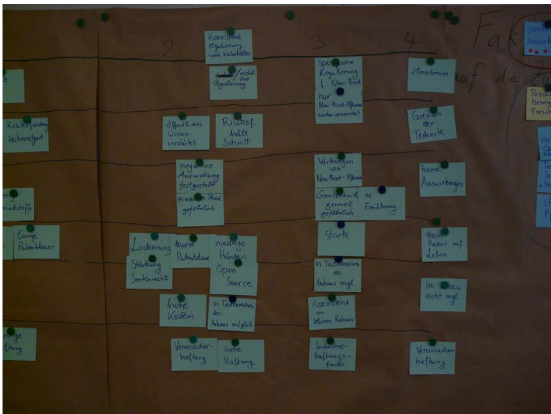
ABB. 9 BEISPIEL BESTIMMUNG VON AUSPRÄGUNGEN FÜR SCHLÜSSELFAKTOREN UND IHRE GRUPPIERUNG, WORKSHOP HOHENHEIM