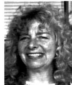
Original 65.536 Bytes

Für die Videokompression gibt es mittlerweile eine Reihe von Verfahren. Die Kompression eliminiert z.B. redundante Information, verteilt Datenspitzen in Datentäler, nutzt menschliche »Sehchwächen« aus (Irrelevanzreduktion), schätzt Nachfolgebilder aus ihren Vorgängern und bedient sich anderer Verfahren, um so zu Reduktionsfaktoren zu gelangen, die heute zwischen 5:1 und 100:1 liegen können.