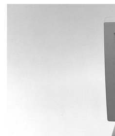
Kompression 38:1 1705 Bytes