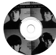
A Hard Days Night